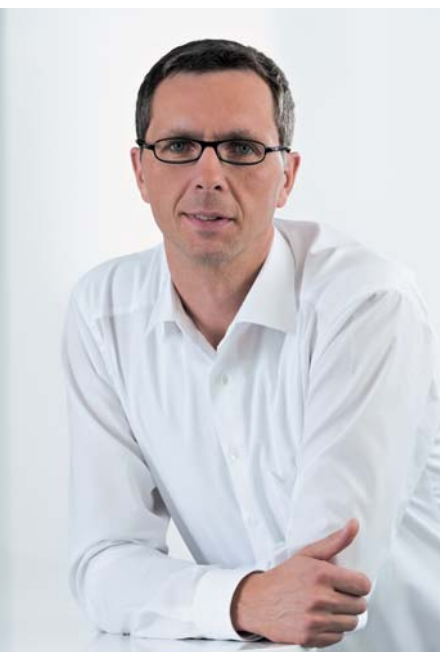
Autor: Dr. Guido Beckmann, Technologie-Marketing, Beckhoff

Wenn alle Sicherungsmaßnahmen zur Aufdeckung von Übertragungsfehlern in einen „Safety-Container“ gekapselt werden, ist die Verwendung eines Sicherheitsprotokolls, unabhängig vom verwendeten Standard-Kommunikationssystem, möglich. Gegebenenfalls verwendete Datensicherungsmaßnahmen des Kommunikationslayers werden für die sichere Übertragung nicht berücksichtigt: Man spricht hier vom „Black-Channel-Prinzip“. Dies hat den Vorteil, dass sicherheitsrelevante und Standard-Prozessdaten auf dem gleichen Kommunikationssystem übertragen werden können. In der IEC 61784-3 werden die Anforderungen für eine sichere Kommunikation, basierend auf dem Black-Channel-Prinzip, definiert und verschiedene Sicherheitsprotokolle beschrieben.